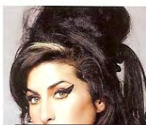
AMY WINEHOUSE > ŽIVLJENJSKA ZGODBA Zadnie